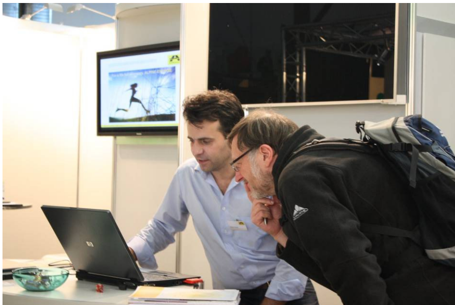
Abbildung 5: Beratung zu Standortgegebenheiten eines Neubaus