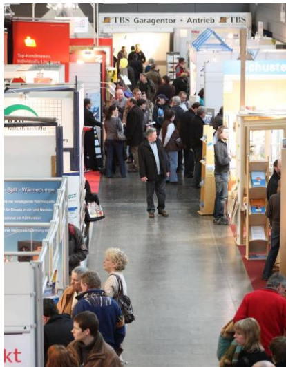
Abbildung 1: Blick auf einen Messegang

Im Laufe Ihres sechsjährigen Bestehens hat sich die Baumesse hausplus zu einem wahren Juwel unter den regionalen Verbrauchermessen des Schwabens etabliert. Mehr als 5000 Interessenten besuchten vom 23.- 25. Januar 2009 die Oberschwabenhalle in Ravensburg. Sie nutzen das Angebot sich über neue Trends, Technologien und Förderungen rund um Hausbau, Ausbau, Modernisierung und Umbau zu informieren.