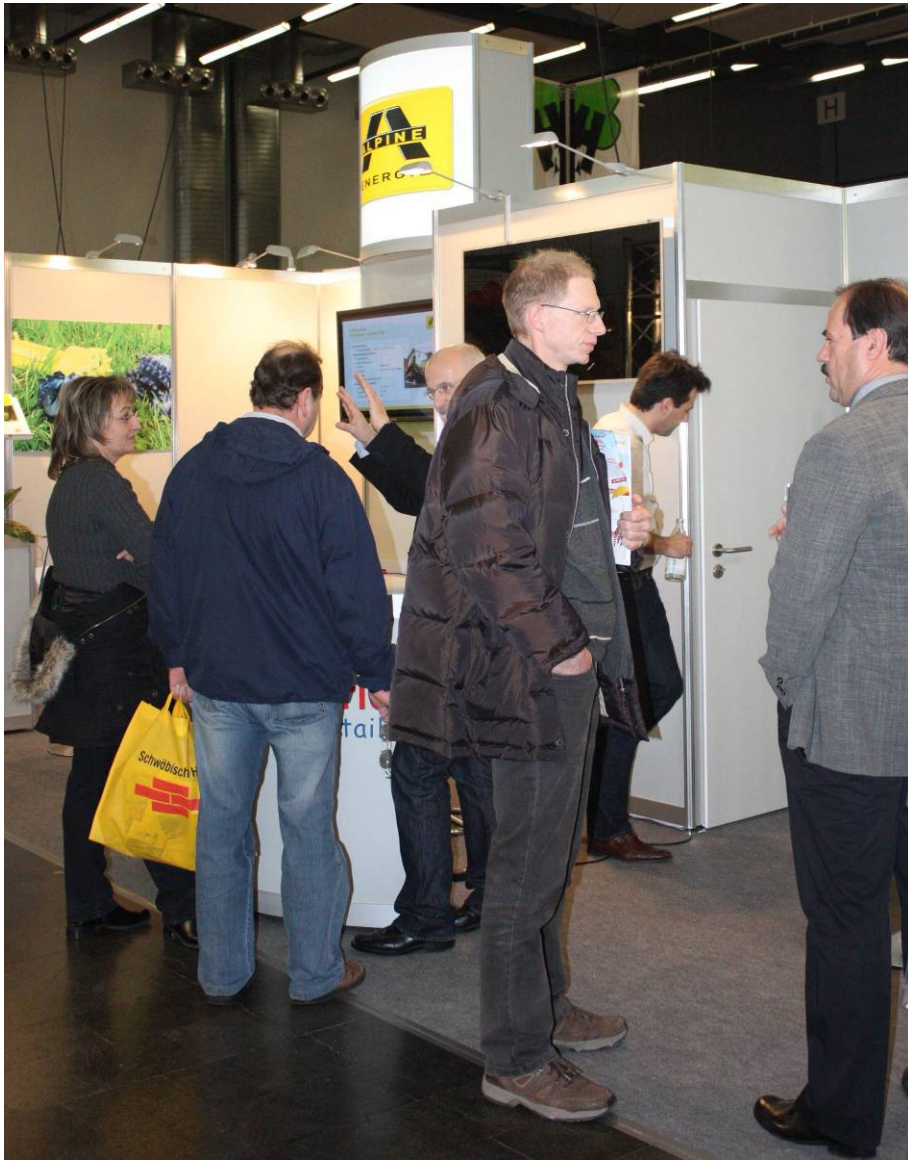
Abbildung 6: Besucherandrang