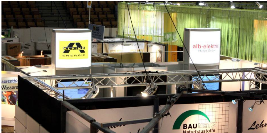
Abbildung 4: Der Stand war nicht zu übersehen