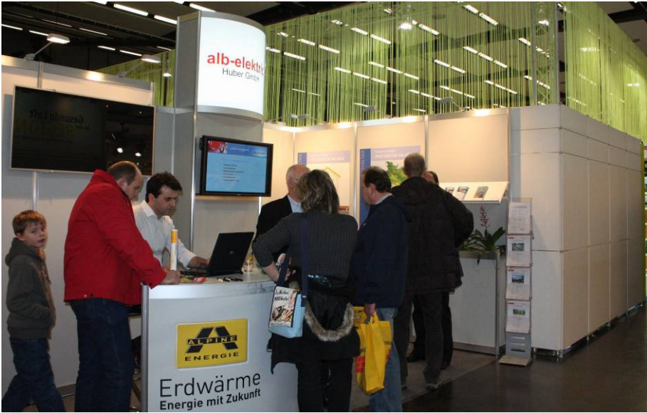
Abbildung 3: Standseite Alb Elektrik