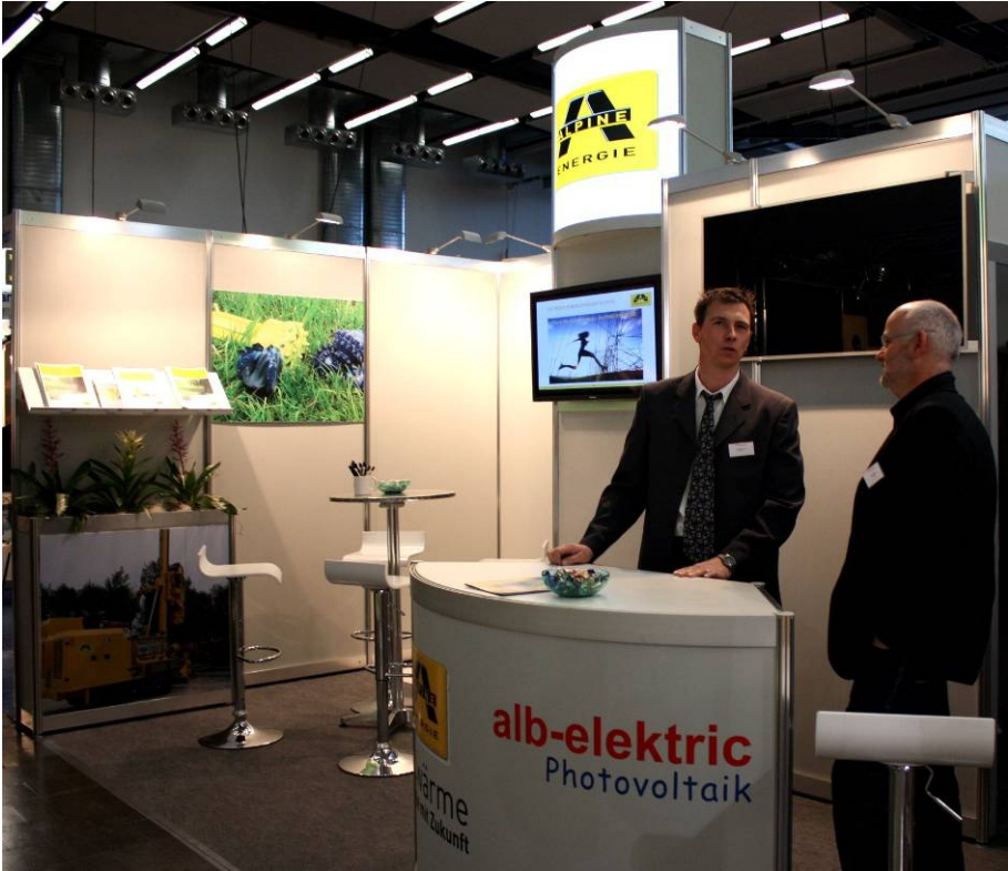
Abbildung 2: Standseite Alpine-Energie